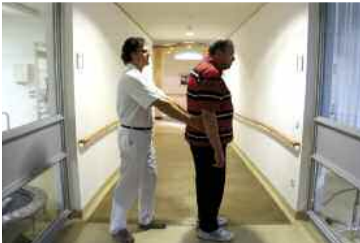
Der Zugtest dient zum Nachweis von „posturaler Instabilität“ – der Fallneigung nach hinten.