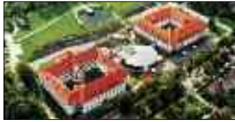
Senioren-Wohnpark Aschersleben GmbH Askaniestraße 40 06449 Aschersleben Tel. 0 34 73/96 18 60