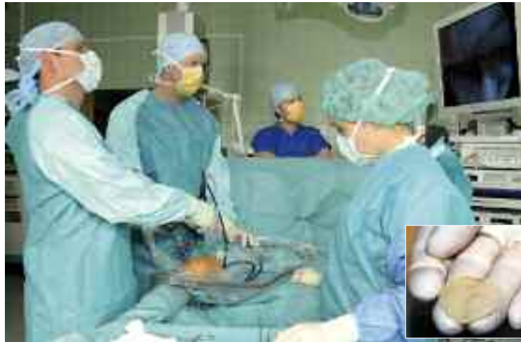
Während des Eingriffs im Kniegelenk wird das elastische Implantat (kleines Foto) eingesetzt.