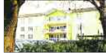
Seniorenzentrum VITA gGmbH Schillerstraße 3 29410 Salzwedel Tel. 0 39 01/8 58 76